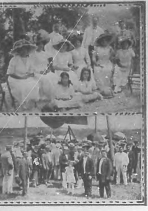
Compañía Cervecera Internacional: Grupo de concurrentes.

ran en el desarrollo de la fábrica de cerveza.