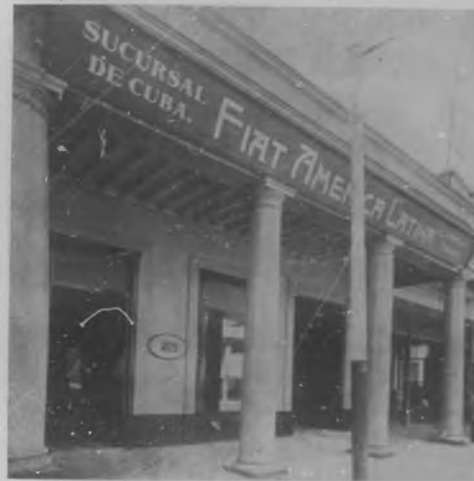
Exterior de la sucursal de la "Fiat América Latina" de Pinar, Cuba, establecida en Boato-calle, número 8.

tenido aquí en famosas carreras verificadas en distintas ocasiones. En esta dora fué tomada del Salón de París, entre las distintas máquinas que para la venta se tienen, resulta el éxito verdaderamente asombroso.