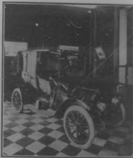
Vista del elegante auto rojo, donde se exhiben los automóviles "Fiat" en esta Sucursal.