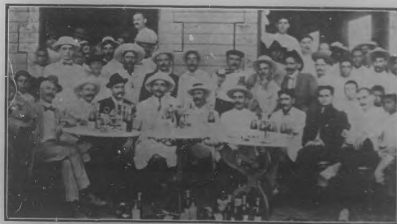
En el Hotel "Nueva Paz",—Grupo de personas distinguidas de la localidad.