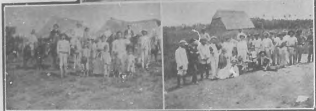
En la finca "Manquita Capiró".—Recreando las veces.