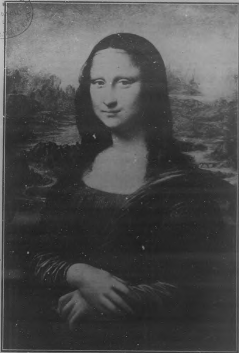
LA GIOCONDA CÉLEBRE CUADRO DE LEONARDO DE VINCI