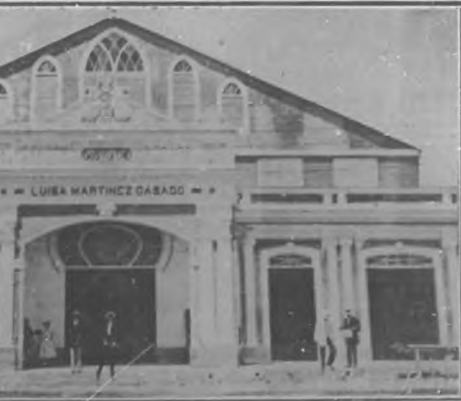
CIENFUEGOS.—Gran Teatro "Luisa Martínez Casado".