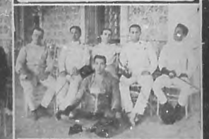
Copa "Parajón", premio del Mach celebrado en el Ateneo el pasado domingo.

Publicamos algunas fotografías como recuerdo del acto, que es sumamente enaltecedor para