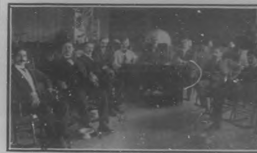
Junta Directiva de la Sociedad "El Progreso"